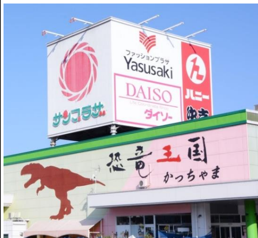
(右)協同組合勝山サンプラザ 川原理事長様 (CMSかわはら電化)