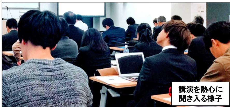
講演を熱心に 聞き入る様子