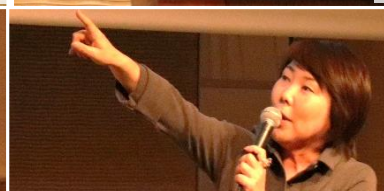
(第一部) 講演① 東京インタラクティブ 大塚社長