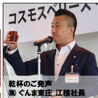
乾杯のご発声 株式会社ぐんま東庄 江積社長